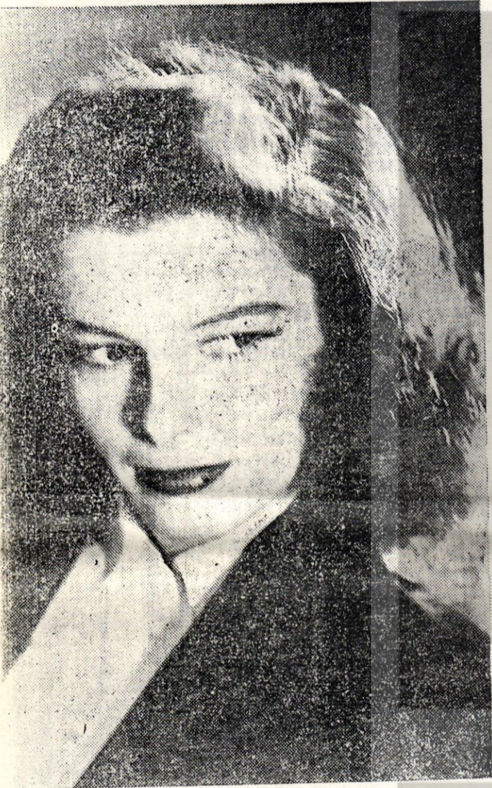
29000 Amerikalı önünde mühim bir nutuk veren yaz perdenin en kuvvetli kadın karakter artistinin Hepburn

Bu kongreye Türkiye namına hiç kimse davet edilmemiştir. Bizim aklımıza bazıları geliyor. Meselâ «İnsan haklarını korumak» veya «fikir hürriyeti namına ortaya çıkıp ta, hak ve hürriyetin boğazlanmasını alkışlayan» barış ve içtimai adalet isteyenlerin zincire vurulmasını teşvik ve tahrik eden entellektüellerimiz herhalde, bu kongreye merasimle kabul olunur. Fahri Kurtuluş ve Hüseyin Cahit gibiler ne güne duruyorlar!