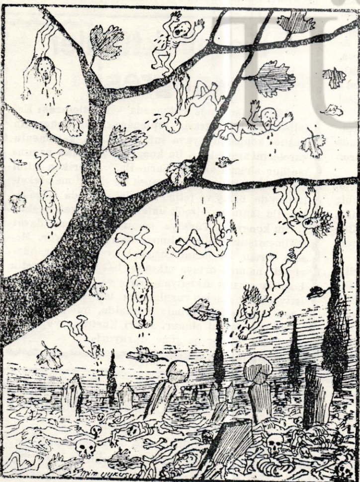
Senede veremden Kırk bin kişi ölen memleketimizde :

Hür insan mahpus olabilir, fakat asla esir olamaz. Aniyot